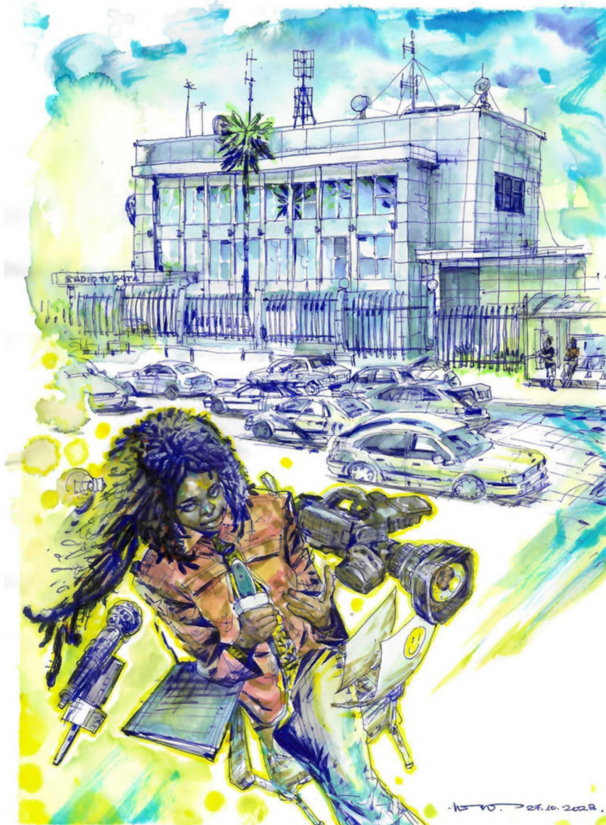
Ilustración de la sede de Radio Bata por Eusebio Nsue Nsue Serie Nuestro patrimonio arquitectónico