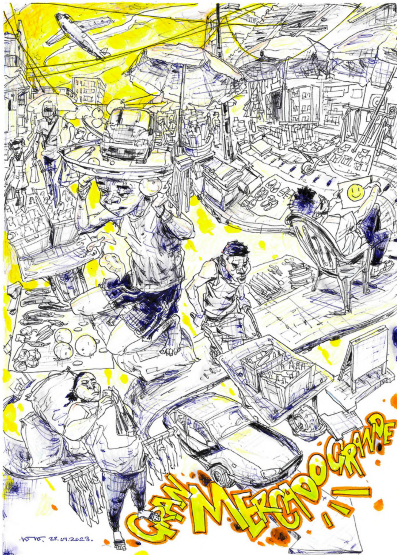
Ilustración del Mercado Grande por Eusebio Nsue Nsue Serie Nuestro patrimonio arquitectónico