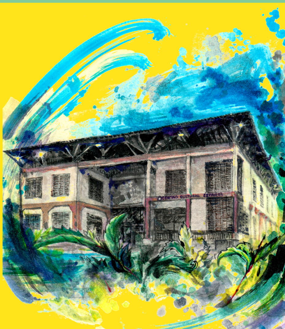
Ilustración del Centro Cultural de España en Bata por Eusebio Nsué. Serie Nuestro patrimonio arquitectónico

WWW.CCEBATA.ORG // FB, INST, TW: @CCEBATA